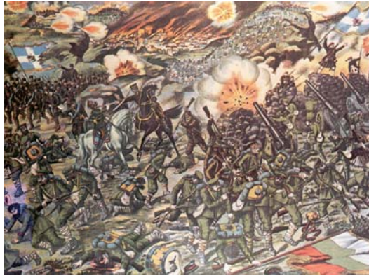
Εικόνα 2: Σκηνή της μάχης του Κιλκίς σε λαϊκή εικόνα της εποχής.

Σαρηγκιόλ, όπου όμως κατά τις 3.00 το απόγευμα καθηλώθηκε από τα έχθρικά πυρά, παρά την κάλυψη του έλληνικού πυροβολικού. Τέλος, έφτασε, καταδιώκοντας μεμονωμένα βουλγαρικά τμήματα στα ύψωματα Άρμουτζη, όπου και διανυκτέρευσε.