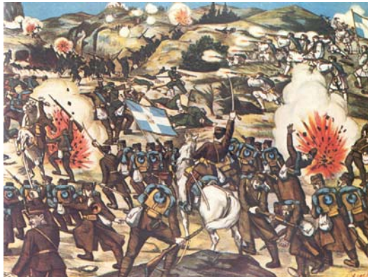
Εικόνα 3: Σκηνή της μάχης του Λαχανά σε λαϊκή εικόνα της εποχής.

Όπως αποδείχθηκε και εκ των υστέρων, οι Βούλγαροι είχαν οχυρώσει την κύρια άμυντική τους γραμμή μπροστά από το Κιλκίς με ένα πραγματικό δάσος όρυγμάτων, ενισχυμένων από πολυβολεία, που στο κεντρικό τμήμα έφταναν σε βάθος μέχρι και 6 χλμ. Έτσι, προκειμένου να επιτευχθεί ή κατάληψη της γραμμής αυτής με όσο το δυνατόν λιγότερες απώλειες, αποφασίστηκε να εκτελέσει η 2 η μεραρχία πλευρικό νυχτερινό αϊφνιδιασμό. Σύμφωνα με αυτό το σχέδιο, το 1 ο και 7 ο σύνταγμα της 2 ης μεραρχίας πέρασαν το Γαλλικό ποταμό και στις 3.30 πλησίαζαν τα έχθρικά χαρακώματα. Οι κινήσεις τους έγιναν αντιληπτές από τους Βουλγάρους, που νόμισαν ότι πρόκειται για γενική νυχτερινή επίθεση. Ακολούθησε ανταλλαγή πυρών του πυροβολικού για μία ώρα περίπου. Στο μεταξύ, στις 4.10 περίπου τα δύο συντάγματα κατέλαβαν την πρώτη έχθρική γραμμή, στις 5.00 τη δεύτερη και έπειτα από σκληρή, σώμα με σώμα, μάχη κατέλαβαν, κατά τις 10.00 το πρωί την τρίτη και πιο οχυρή θέση.