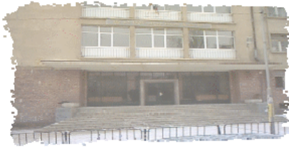
Το 12ο Ενιαίο Λύκειο «Τσάρος Ιβάν Ασέν Β'» στην Σόφια

Το σχολείο αυτό είναι το μοναδικό κρατικό εκπαιδευτικό ίδρυμα στην Σόφια, στο οποίο λειτουργούν μαθήματα νέας Ελληνικής. Το Σωματείο μας ανταποκρίθηκε στις ανάγκες