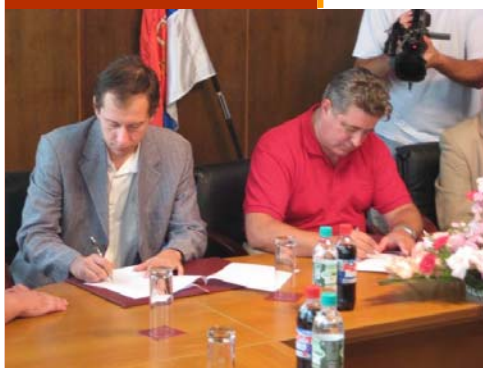
Υπογραφή μνημονίου στα Βράνια μεταξύ του Γ. Γραμματέα της Νηός και του Δημάρχου Βρανίων

γασίας μεταξύ του Σωματείου μας, του Δήμου και του Λαϊκού Πανεπιστημίου Βρανίων.